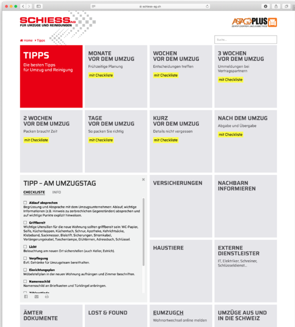
Die besten Tipps zu Umzug und Reinigung.

lisierbar sind, erforderte aber von den Machern ein neues Denken. Zudem fanden wir uns in der ungewohnten Rolle kreativer Konzeptberatung wieder. Die Topix AG wurde zur Ideen-Werkstatt, welche nicht nur treffende Schlagworte entwickelte, sondern auch eine grosse Menge an Informationen und Dokumenten zum Thema Umzug und Reinigung kontextuell zu sortieren, zu verbinden und einzupflegen hatte.